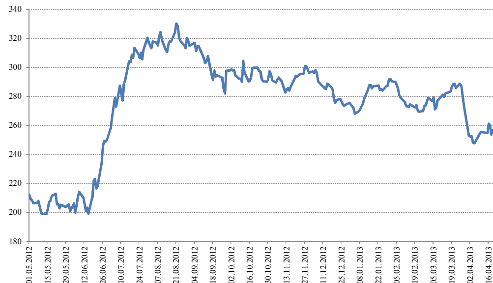
График 3. Күн карама майынын дүйнөлүк баасынын динамик., 01.05.12-22.05.13 (бир тоннасы АКШ долл.)