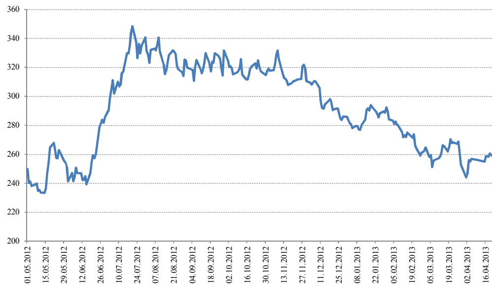
График 2. Жүгөрүгө болгон дүйнөлүк баалардын динамикасы, 01.05.12-22.05.13 (бир тоннасы АКШ долл.)