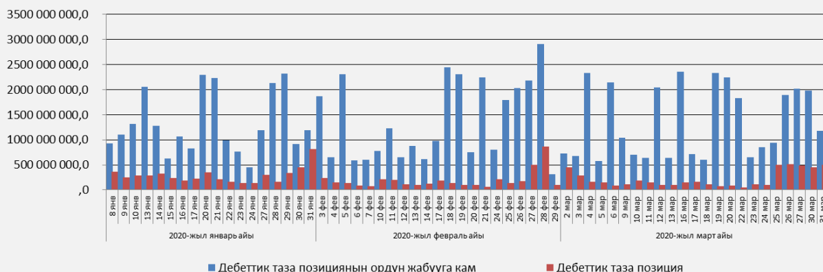
4-график. 2020-жылдын 1-чейреги ичинде Пакеттик клиринг системасындагы дебеттик таза позициянын суммардык маанисинин жана анын ордун жабууга каралган камдын катышы (млн сом)

акыркы эсептешүүлөрдү жүргүзүү үчүн иш жүзүндө талап кылынгандан орточо алганда 5,8 эсеге көбүрөөк каражаттарды камга коюшкан.