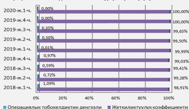
6-график. Бирдиктүү банктар аралык процессинг борборунда операциялык тобокелдиктин жеткиликтүүлүк көрсөткүчүнүн катышы

Системадагы операциялык тобокелдиктер. Улуттук төлөм системаларынын ишине жүргүзүлгөн мониторингдин жана талдап-иликтөөлөрдүн жыйынтыгы боюнча «Элкарт» банктык төлөм карттары менен эсептешүү системасында 2020-жылдын 1-чейрегинде системанын жеткиликтүүлүк деңгээли 100,00 пайызды түзгөн.