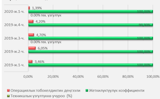
5-график. 2020-жылдын 1-чейреги үчүн Пакеттик клиринг системасында жеткиликтүүлүк көрсөткүчүнүн жана операциялык тобокелдиктин катышы

2020-жылдын 1-чейрегинде ПКС ишине мониторинг жүргүзүүнүн жыйынтыгы боюнча жеткиликтүүлүк көрсөткүчү 99,90 пайызды түзгөн. Жеткиликтүүлүк деңгээлинин азаюусу 2020-жылдын 2-мартында системадагы сертификаттарды өзгөртүү боюнча техникалык иш чараларга байланыштуу келип чыккан. Системадагы операциялык тобокелдик деңгээли системанын иш регламентинин узартылышына байланыштуу 4,20 пайыз чегинде катталган (катышуучулар тарабынан узартуулардын суммардык убактысы 16 саат 30 мүнөттү, анын ичинен максималдуу узартуу убактысы 2 саат 30 мүнөттү түзгөн).